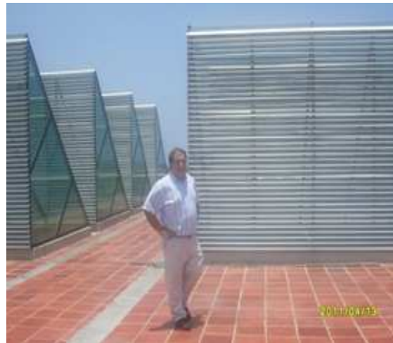
Construcción Planta de Tratamiento en Punta Canoa