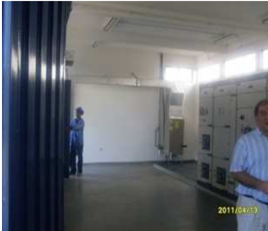
Construcción de la Estación de Bombeo de Aguas Residuales Ricaurte