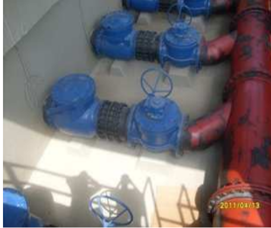
Construcción Estación de Bombeo Ceballos, Contratista Mejía y Villegas Constructores S.A., Valor contratado $2.617.218.225,00.