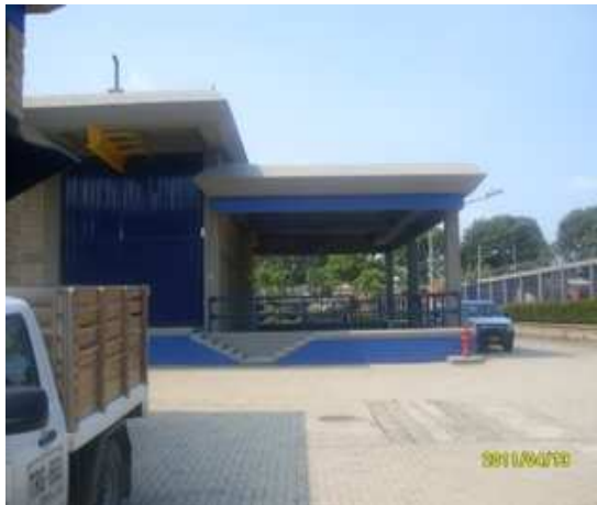
Construcción de la Estación de Bombeo de Aguas Residuales Ricaurte, Contratista Consorcio Ferpal (Construcciones Namus Ltda - D&S Ltda - Rmy CIA Ltda), Valor contratado $8.580.841.306,00.