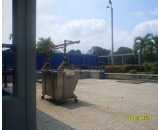
Construcción de la Estación de Bombeo de Aguas Residuales Ricaurte