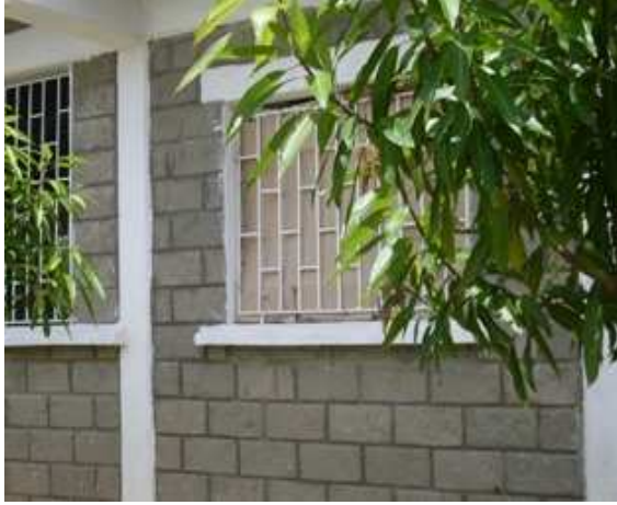
Columnas- Caretas Hierro-Levante block No.6