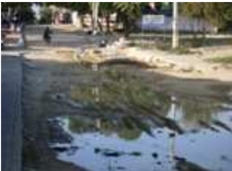
Zona por reparar