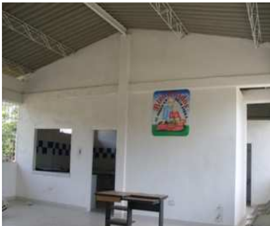
Vista interior del CDV