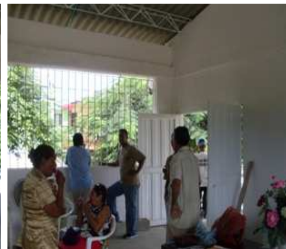
Puerta principal metálica dos hojas- Careta Hierro-Pintura Vinilo-