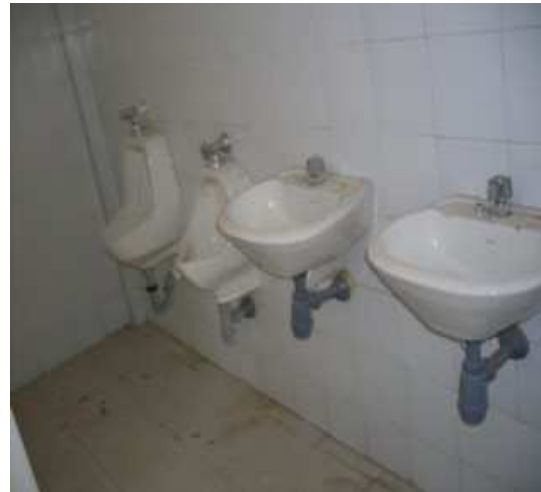
Suministro e instalación de lavamanos y Orinales- Enchape cerámica arcadia.