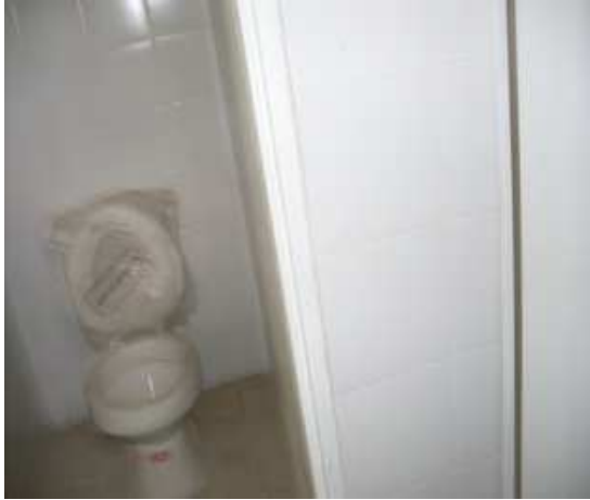
Suministro e instalación de sanitario Enchape cerámica arcadia.