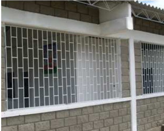
Casetas en hierro ventanas Levante en block No.6 Vigas de amarre superior