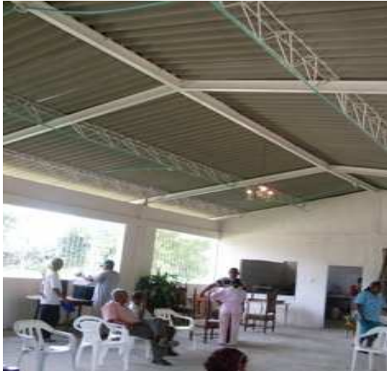
Cerchas metálicas-Cubierta eternit- Pintura en vinilo-Caretas hierro.