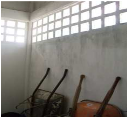
Instalación de calados-Pintura Vinilo.