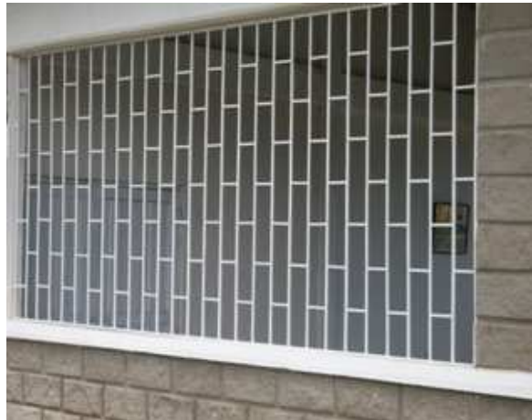
CARETAS EN HIERRO VENTANA