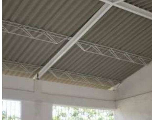
Cubierta en eternit Cerchas metálicas