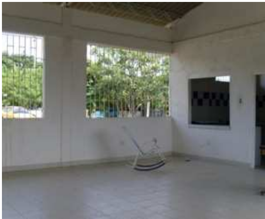
Vista interior CDV obras ejecutadas