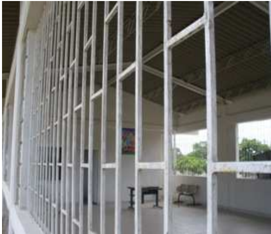
VISTA INTERIOR CDV