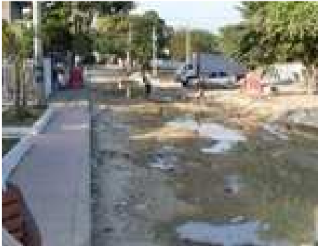
Zona por reparar