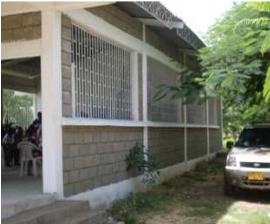
Sobrecimiento-Columnas-Caretas Hierro Levante block No.6-Viga de amarre superior