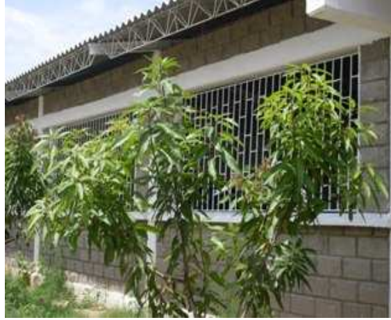
Cerchas metálicas-Viga de amarre superior Cubierta en eternit-Caretas Hierro-Column