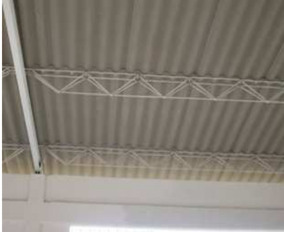
Cubierta en eternit Cerchas metálicas