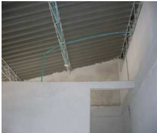
Cerchas metálicas-Cubierta eternit-Pintura Vinilo-Instalaciones eléctricas-