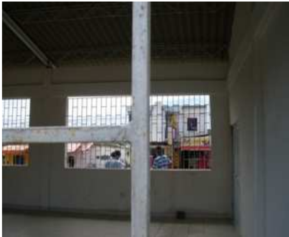
VISTA CARETAS EN HIERRO VENTANA