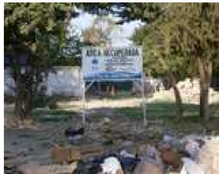
Zona por reparar