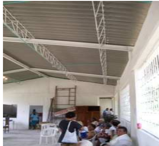
Cerchas metálicas-Cubierta eternit- Instalaciones eléctricas-Pintura vinilo-