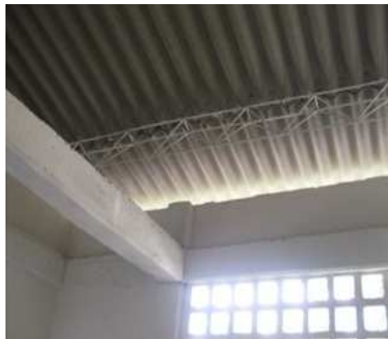
Viga de amarre superior-Cerchas metálicas- Cubierta en eternit-Instalación de calados.