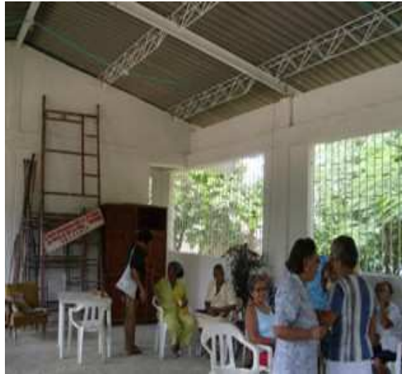
Cerchas metálicas-Cubierta eternit-Pintura en Vinilo-Caretas Hierro.