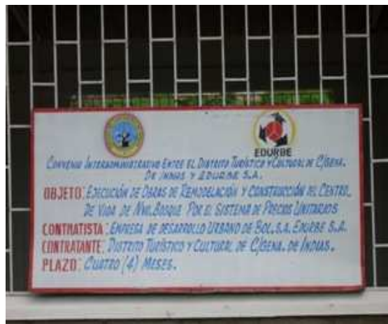
VALLA DE IDENTIFICACION CONTRATO