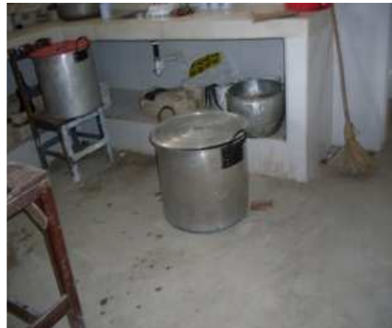
Construcción de mesón para la cocina