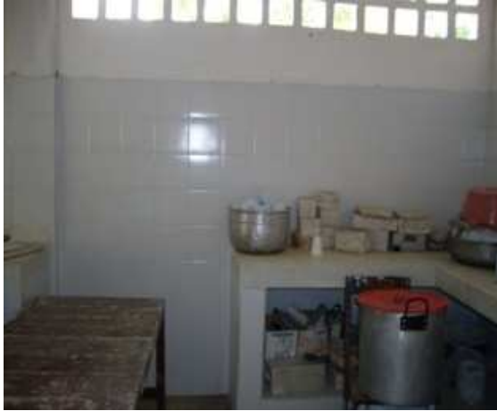
Construcción de mesón cocina-Enchape Cocina- Instalación de calados.