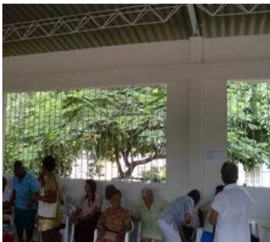
Pintura Vinilo-Cerchas metálicas-Cubierta Eternit-Viga amarre superior-Careta Hierro