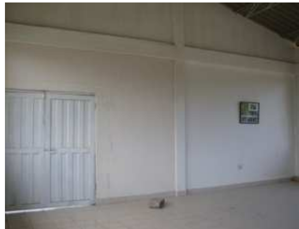
Vista Interior del CDV.