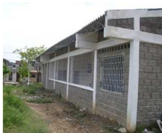
VISTA LATERAL IZQUIERDA