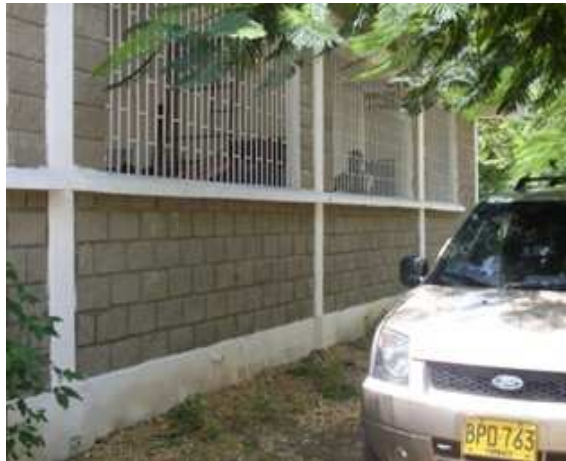
Sobrecimiento- Levante block No.6 Caretas Hierro-Columnas