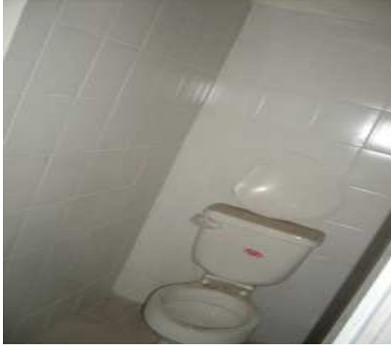
Suministro e instalación de sanitario Enchape cerámica arcadia.