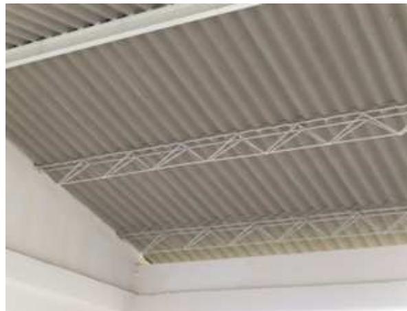
Cubierta en eternit- Cerchas metálicas