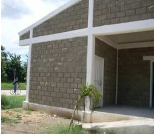
VISTA FRONTAL C.D.V. SOCORRO