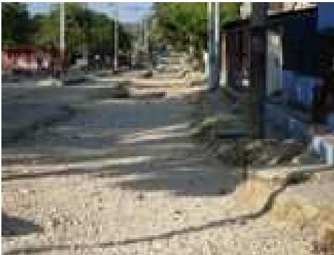
Conformación de la sub-base