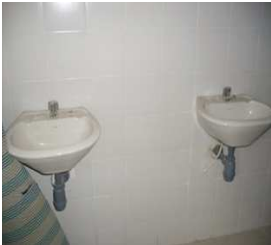
Suministro e instalación de lavamanos- Enchape cerámica arcadia.