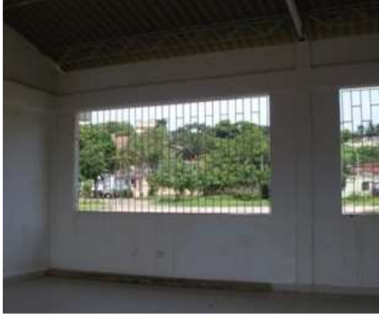
Vista interior CDV, obras ejecutadas