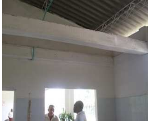
Viga de amarre superior-Cerchas metálicas Cubierta eternit.