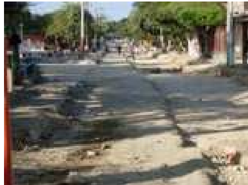
Conformación de la sub-base