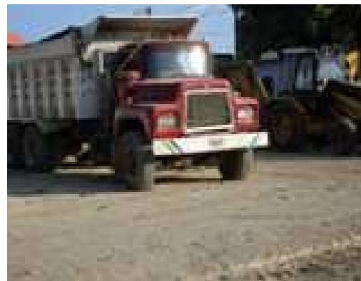
Maquinaria del contratista.