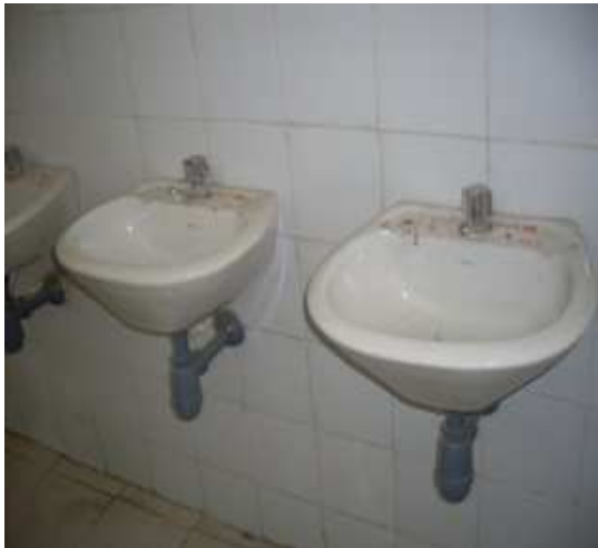
Suministro e instalación de lavamanos- Enchape cerámica arcadia.