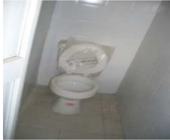
Suministro e instalación de sanitario Enchape cerámica arcadia.