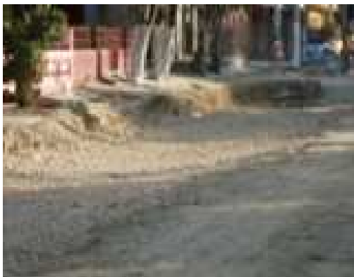
Conformación de la sub-base