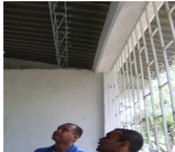
Caretas Hierro-Cerchas metálicas-Viga amarre