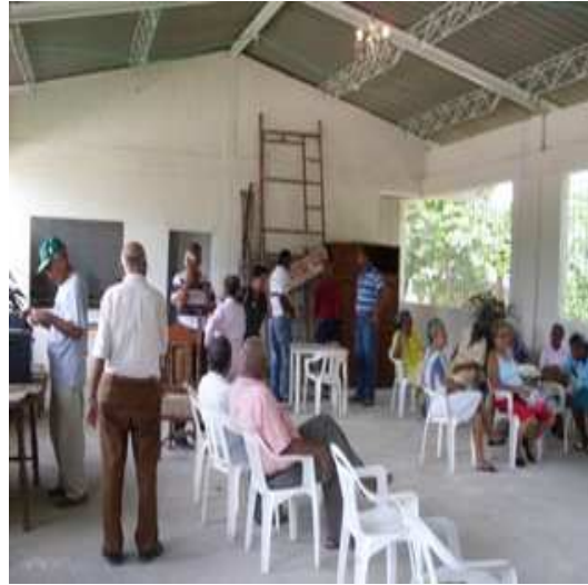
Cerchas metálicas-Cubierta eternit-eléctricas - Pintura Vinilo-Caretas Hierro. Viga de amarre superior.