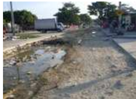
Zona por reparar