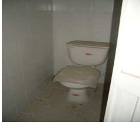
Suministro e instalación de sanitario Enchape cerámica arcadia.