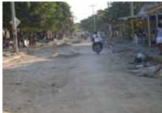
Conformación de la sub-base