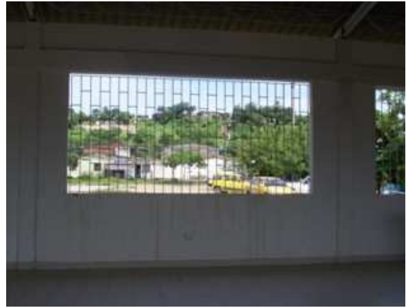
Vista interior CDV obras ejecutadas