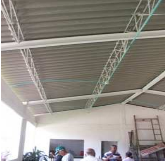
Cerchas metálicas-Cubierta eternit- Inst. Pintura en vinilo-Caretas hierro.