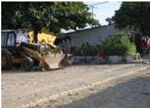
Maquinaria del contratista