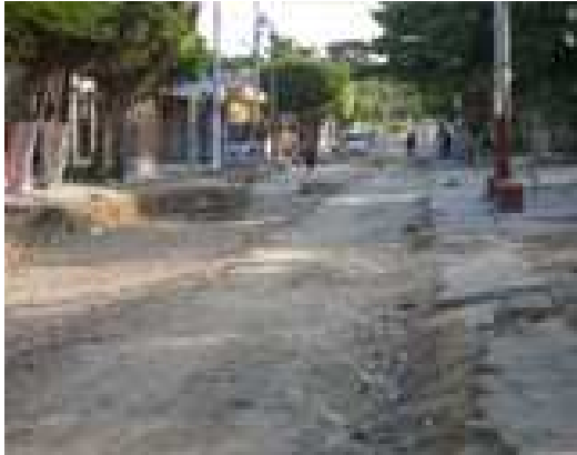
Conformación de la sub-base