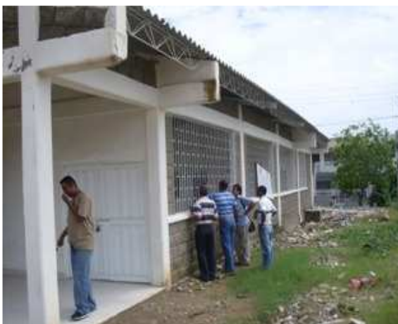
VISTA LATERAL DERECHA