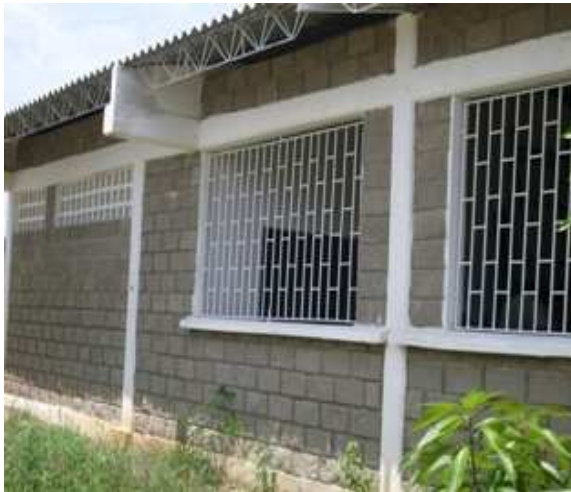
Columnas-Sobrecimiento-Caretas Hierro- Viga amarre superior-Levante block No.6- Inst. de calados-Cerchas metálicas-Cubierta.