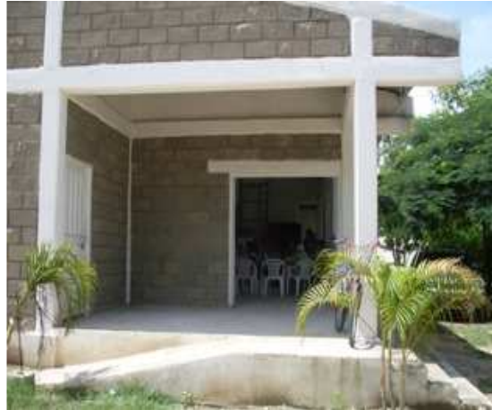
VISTA FRONTAL C.D.V. SOCORRO