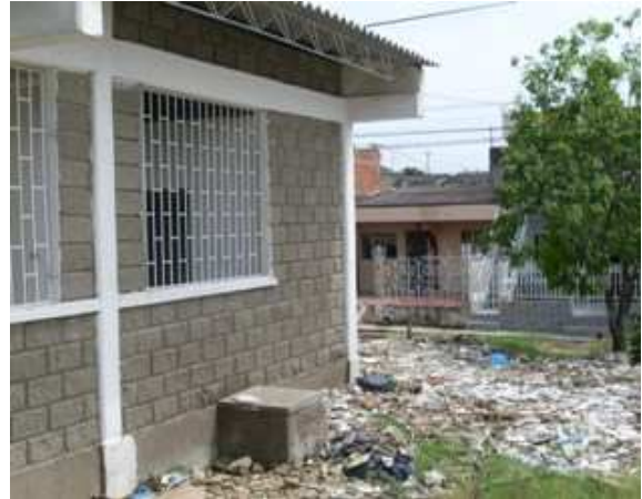
Casetas en hierro ventanas - Registro Sanitario Levante en block No.6 - Columnas Vigas de amarre superior- Cerchas metálicas Sobrecimiento – cubiertas en eternit