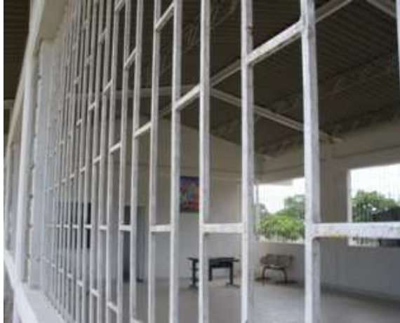
VISTA INTERIOR CDV