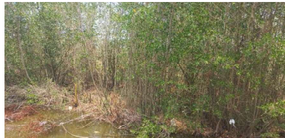
Fotografías visita de inspección – Canal Chiamarúa