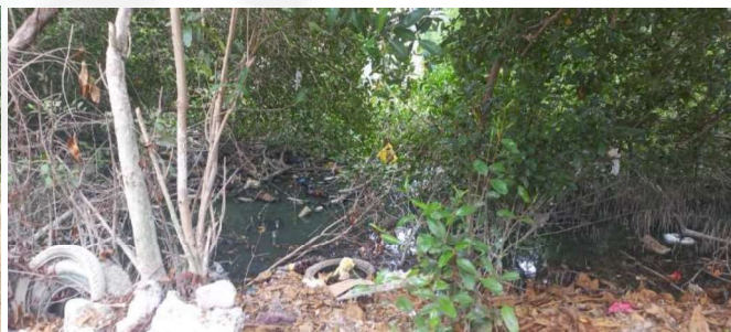
Fotografías visita de inspección – Canal Calicanto Viejo