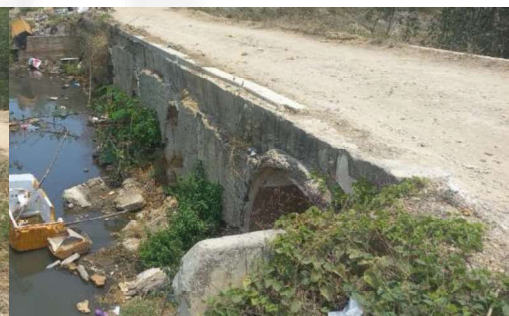
Fotografía visita de inspección – Canal Chiamarúa