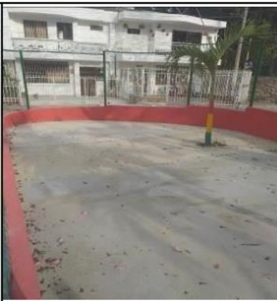
Foto No.12 Plantilla en concreto de 3000 psi terminada en zona de juegos