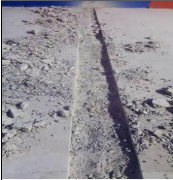
Foto No. 1 Demolición de tramo de plantilla en mal estado