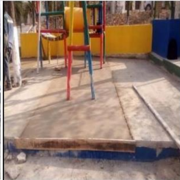
Foto No. 4 Concreto de 3000 psi para plantilla