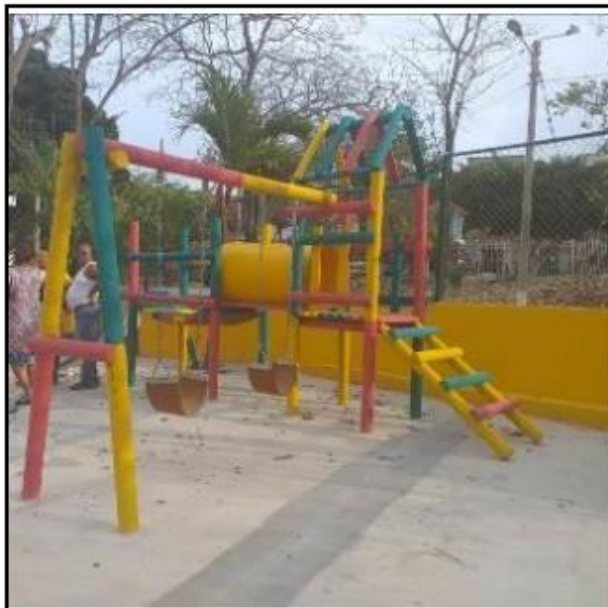
Foto No.11 Pintura de juegos infantiles