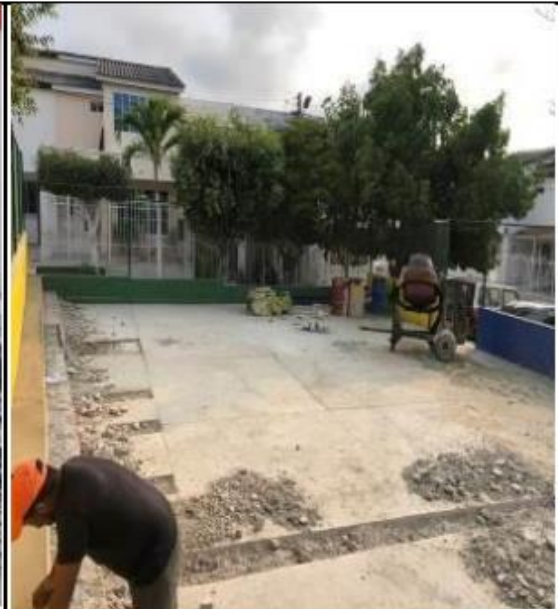
Foto No. 2 Demolición de tramo de plantilla en mal estado