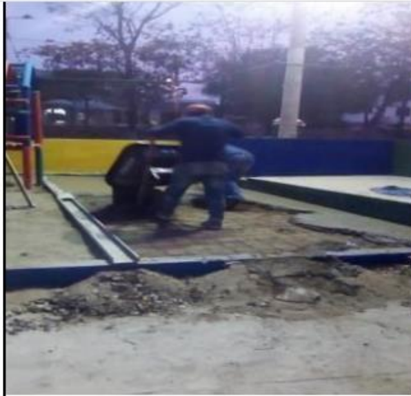
Foto No. 3 Concreto de 3000 psi para plantilla