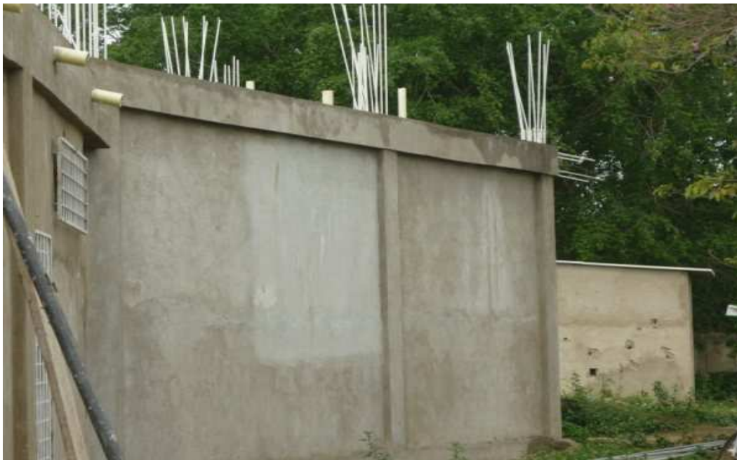
EXTERIORES CAP SAN FERNANDO