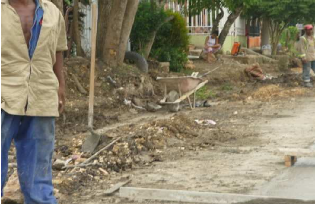
ADECUACION CALLE 102 SAN JOSE DE LOS CAMPANOS