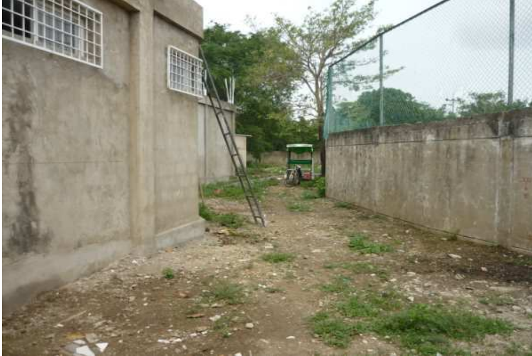
EXTERIORES CAP SAN FERNANDO