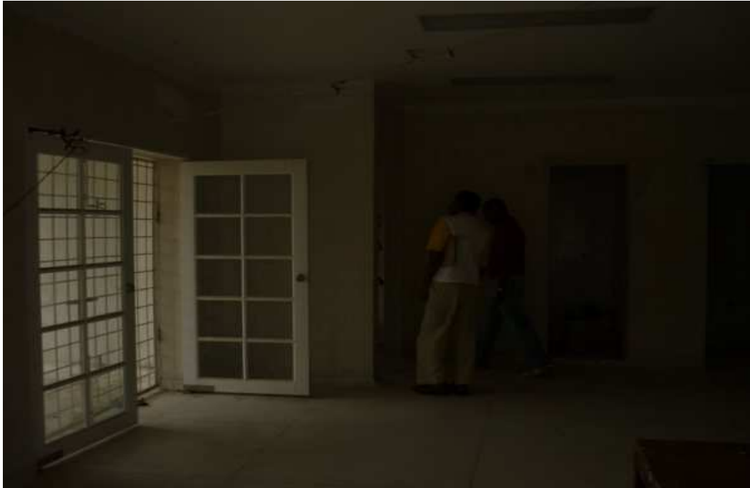
INTERIORES CAP SAN FERNANDO