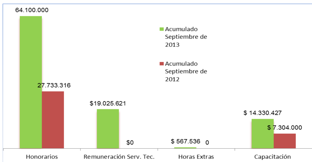
Grafica 1: Comportamiento Rubros de Gastos Administrativo de Personal